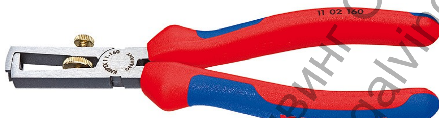
11 02 160 Полирана глава, двукомпонентни ръкохватки