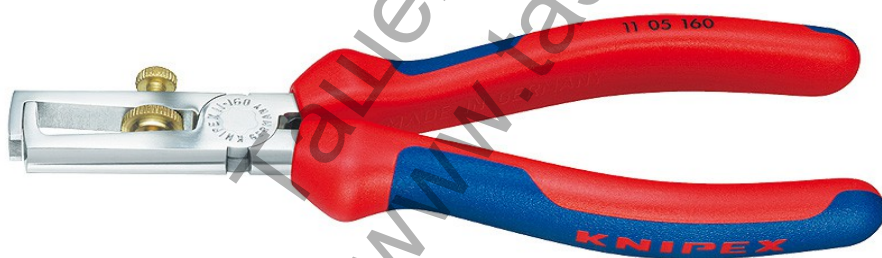
11 05 160 Хромирана челюст, двукомпонентни ръкохватки